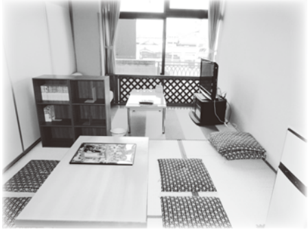
マンガ、TV、DVD等を完備。Wi-Fiも利用可。

ひなたぼっこは、ひきこもり状態にある方、経験者等を対象とした居場所です。マンガを読んだり、昼寝をしたり、ゲームをしたり、自分のペースで、のんびり、ゆったり過ごせる場所です。 「家ではあまりくつろげない」「昼間過ごす場所がない」「家と違う場所でくつろぎたい」「ちょっと話を聞いてほしい」等々、様々な方にご利用いただければと思います。