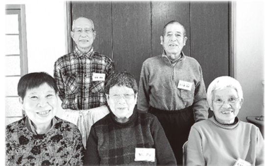
東谷はつらつ教室参加者の皆さま

はつらつ教室を始めてみたい方、一緒に「はつらつ体操」を試してみませんか？ 随時、体験会も開催しておりますので、ご興味のある方は、左記までお気軽にご連絡ください。