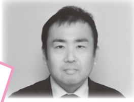
生活相談支援センター 主任相談支援員

市民の皆様や社会福祉協議会職員と一緒に、瀬戸内市の福祉充実のために少しでもお役に立ちたいと思っています。趣味は園芸。クリスマスローズが大好きです。気軽にお声をかけてください。よろしくお願ひします。