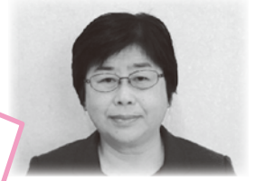
事務局長 権利擁護センター長 生活相談支援センター長