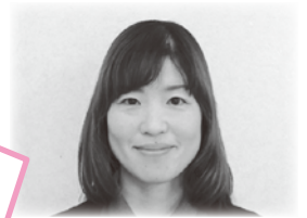
地域包括支援センター 主事補

他市の社会福祉協議会に14年間勤務していました。これまでの職務経験を活かし、市民のみなさまが安心して過ごせる「福祉のまちづくり」に貢献できるよう頑張ります。趣味は、サッカーです。よろしくお願ひします。