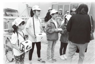
FOS 少年団による街頭募金