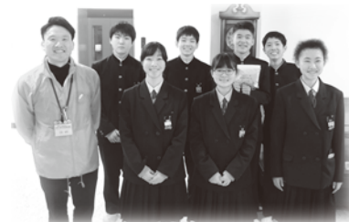
長船中学校からの学校募金