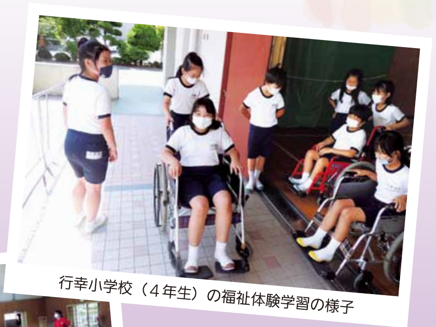
行幸小学校（4年生）の福祉体験学習の様子