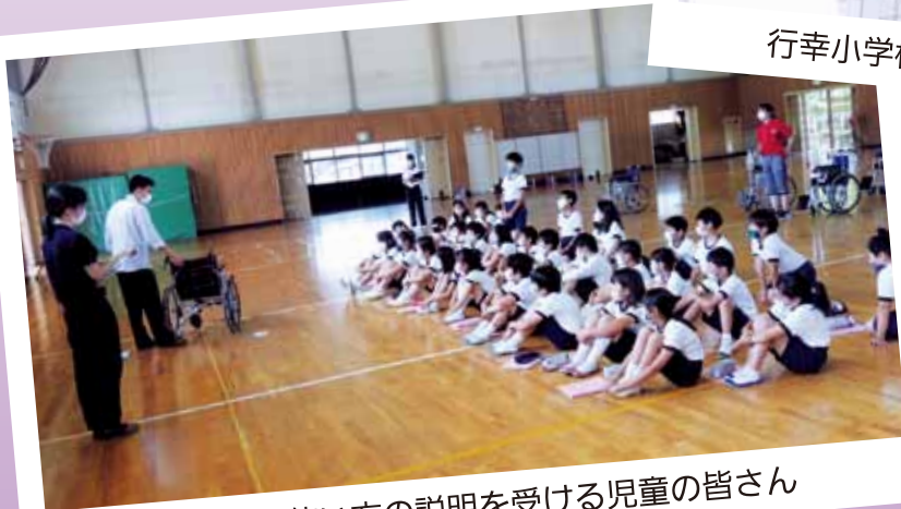
車椅子の使い方の説明を受ける児童の皆さん