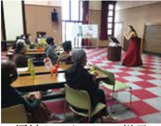
福祉センターでの様子

今まで、興味はあっても遠くて行けない、交通の便が悪くて行けない、ということも多く耳にしてきました。そこで、出かける機会の減っている方、認知症が心配な方を対象にゆつくり過ごせる集いの場をみなさんがお住まいの地域で提供させていただきます。それが「出張つくしカフェ」です。認知症の方の「やりたいこと」を応援させていただきます。