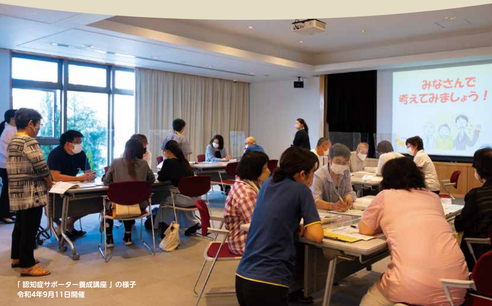
「認知症サポーター養成講座」の様子 令和4年9月11日開催