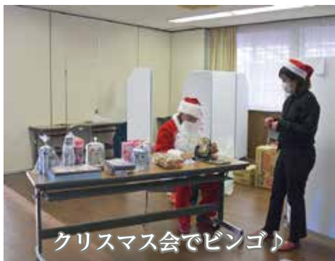
クリスマス会でビンゴ♪

【 問い合わせ先 】 瀬戸内市ひきこもりサポートセンターひなた 電話:0869-24-8650 FAX:0869-24-1850 メール: hinata@setouchisyakyo.or.jp