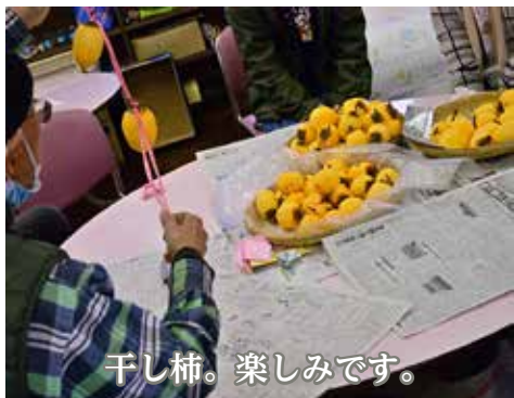
干し柿。楽しみです。

そして、心のエネルギーが貯まったところで、ご本人が「安心・安全」を感じられる「社会的な居場所」へとつながるような働きかけが必要となってきます。 『ひなたぼっこ長船』は、利用される方が安心・安全が感じられ、社会や誰かから必要性と役割を感じられるような居場所として機能できるように運営していきたいと思えます。