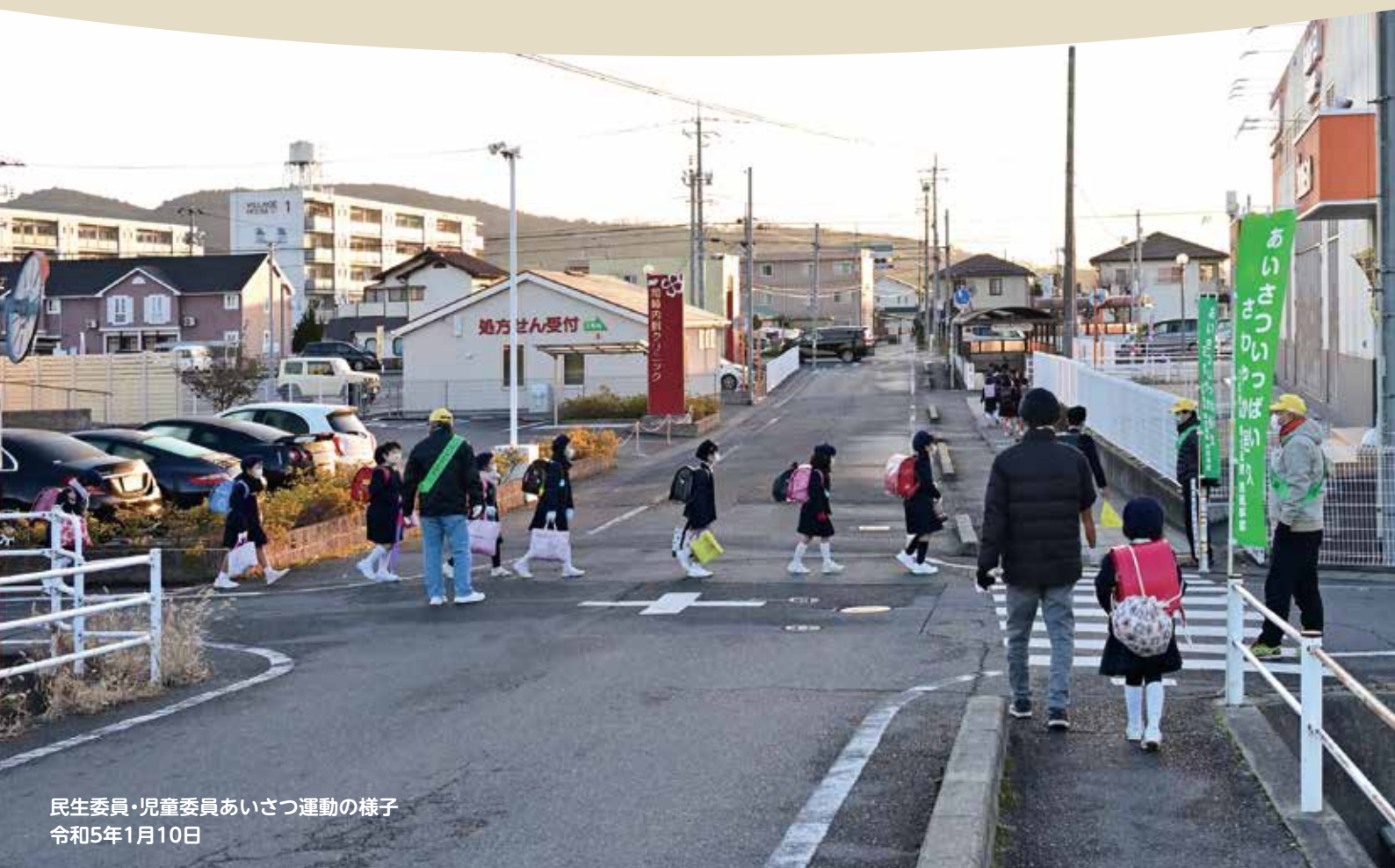
民生委員・児童委員あいさつ運動の様子 令和5年1月10日