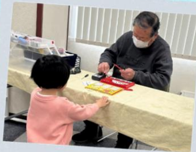
おもちゃおるかなあ... (おもちゃの病院)