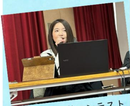
ふくし活動コンテスト

・令和8年3月7日、協議会の事務局である瀬戸内市社会福祉協議会が主催する「第1回ふくしのまちづくりフェスタ」に共催として参画し、ささえ愛ネットせとうちの事業紹介を実施しました。