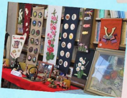
きらめきアート作品展