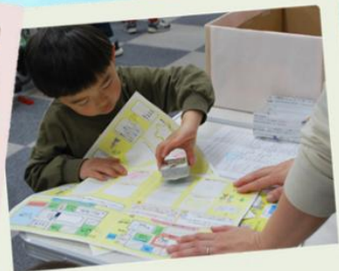
スタンプラリーに挑戦！