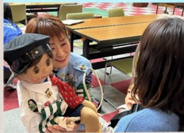
しょうちゃんも大活躍！