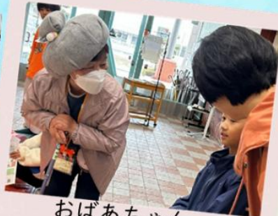
おばあちゃん、 どうしたの？ (あったか声かけ体験)